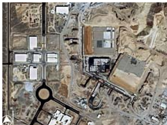
شکل ۳ : ساختمان زیر زمینی در نطنز ، کارگاه غنی سازی اورانیوم با سانتریفوژ

در اینجا تا سال ۲۰۰۴ محوطه ای برای گنجاندن ۳۰۰۰ عدد سانتریفوژ در نظر گرفته شده بود که حالا به فضائی حدود ۱۰۰ متر در ۱۰۰ متر وسعت داده شده که می تواند ۵۰ هزار دستگاه را در خود جا بدهد. طبق گزارش البرادعی در این زیر زمین سانتریفوژ P1 و سانتریفوژ P2 که پاکستانی هستند، و همینطور نوع ساخته شده در اروپا نصب شده است.