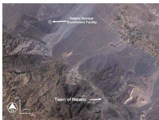
شکل ۲ : محل غنی سازی در نطنز

اتمی برای تولید انرژی نیاز داشته باشد، این استخراج از نظر اقتصادی بی معنی است. چه اورانیوم و یا سوخت اتمی را می توان بسیار ارزان تر از کشورهای دیگری چون ازبکستان تهیه نمود. استدلال غیر وابسته بودن و یا خودکفائی مملکت حرف پوچی است. زیرا اولاً امروز هیچ کشوری در دنیا خود کفا نیست. در ثانی جمهوری اسلامی در مورد گندم و گوشت، بنزین، مواد پدکی برای صنعت نفت، حتی لباس و پوشاک و چادر زنان وووو سخت به کشورهای دیگر جهان وابسته است. به شهادت عکسهای هوائی تهیه شده بوسیلهء ماهواره ها(شکلهای ۲ و ۳)، غنی کردن اورانیوم در نزدیکی نطنز در هشت متری زیر زمین صورت میگیرد.